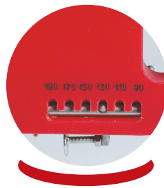
Calibreur automatique de 90 à 190 grammes Automatic caliber from 90 to 180 grams