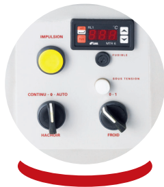
Tableau de commande Control panel

Pièces mécaniques de grande qualité + bague d'étanchéité à l'arrière du corps Mechanicals parts of great quality + tightness ring